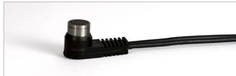
コストパフォーマンスに優れた二振動子型探触子 D7910

27MG にマッチしたローコストな二振動子型探触子 D7910 は、腐食検査における多くの基本的な減肉測定に対応することができます。またオリンパスでは、そのほかにも、極薄あるいは極厚の材料や、小径パイプの測定などに適したさまざまなタイプの二振動子型探触子も取り揃えています。27MG は自動探触子認識機能付きのため、オリンパスの探触子を使用することにより、デフォルトの V パス補正を自動的に呼び出し、その性能を最適化することができます。