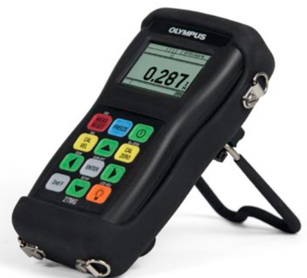
オプションの本体ゴム製保護ケース付き 27MG

標準付属品は、国・地域によって異なります。詳しくは、お近くのオリンパスまでお問い合わせください。